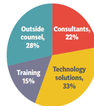
Distribution of Additional GDPR Compliance Budget (Base: Falls Under GDPR, Will Spend More)