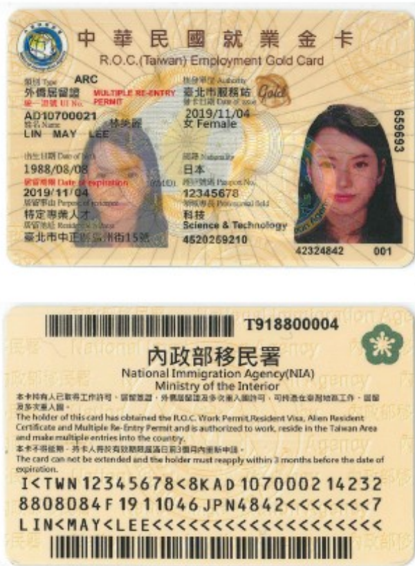
圖 1 新版就業金卡樣張