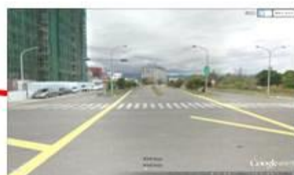
臨海路與馬亨亨路口：2盞