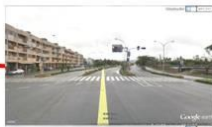
浙江路與馬亨亨路口：4盞