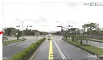
中興路與馬亨亨路口：4盞