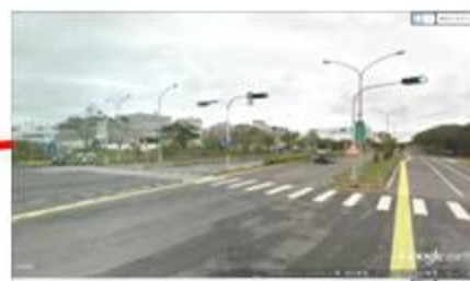
中興路與馬亨亨路口：4盞