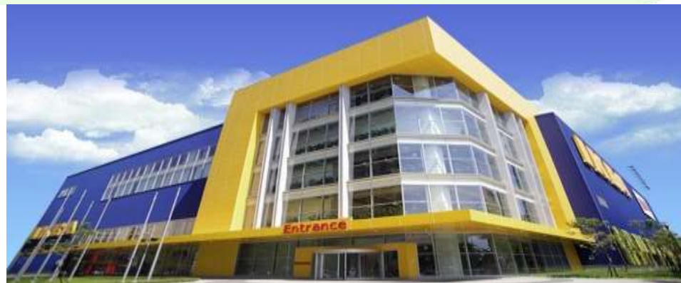
臺中市市81公有市場用地BOT案 - 國泰人壽保險股份有限公司