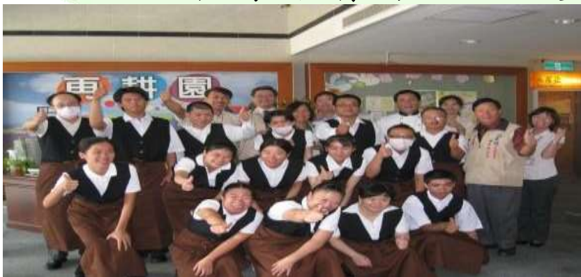
嘉義市身心障礙綜合園區一再耕園OT案