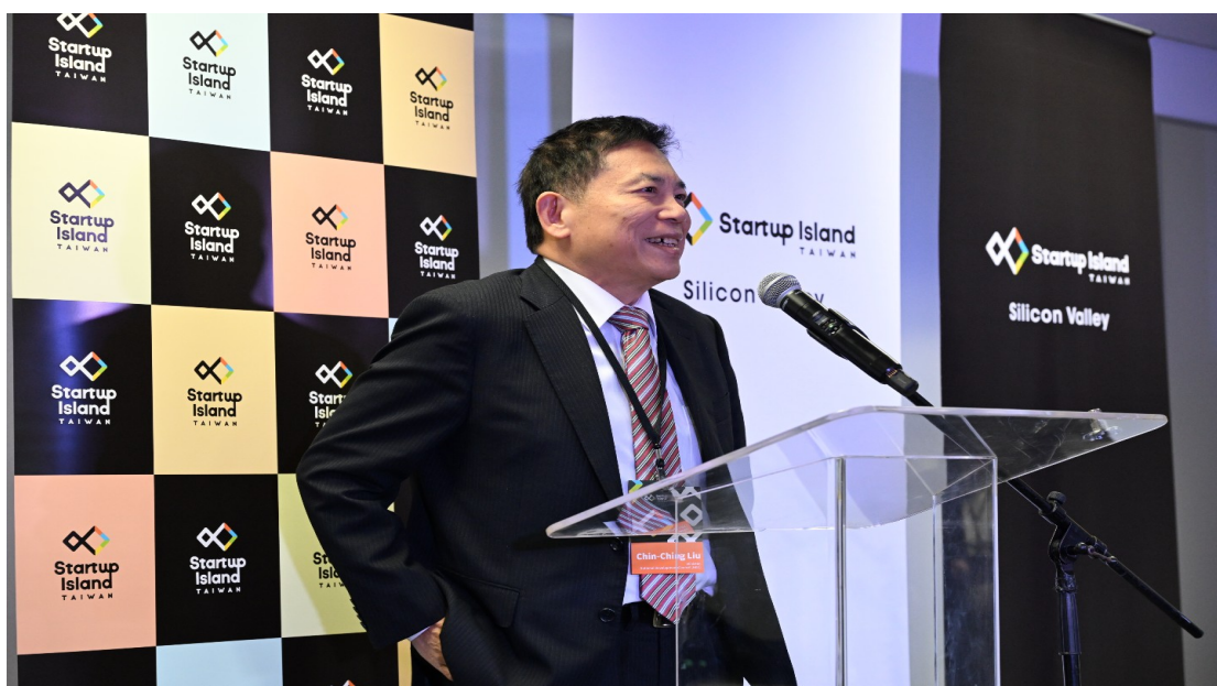
圖 1. 國發會劉鏡清主委於矽谷新創基地開幕致詞。