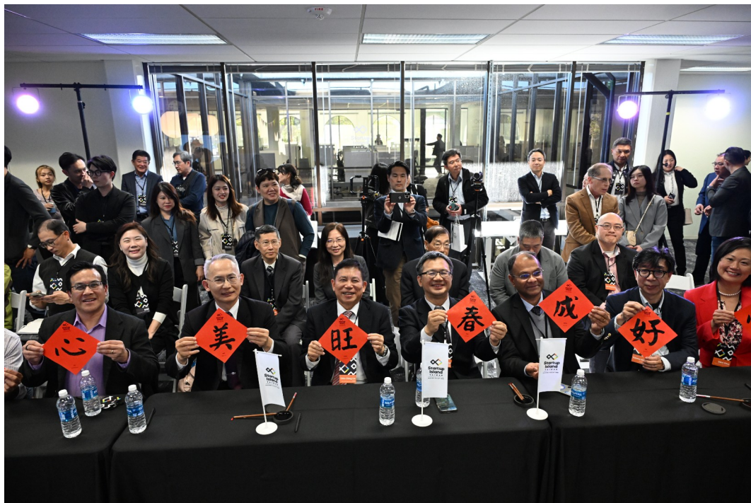
圖 5. 開幕儀式出席貴賓寫春聯合影。