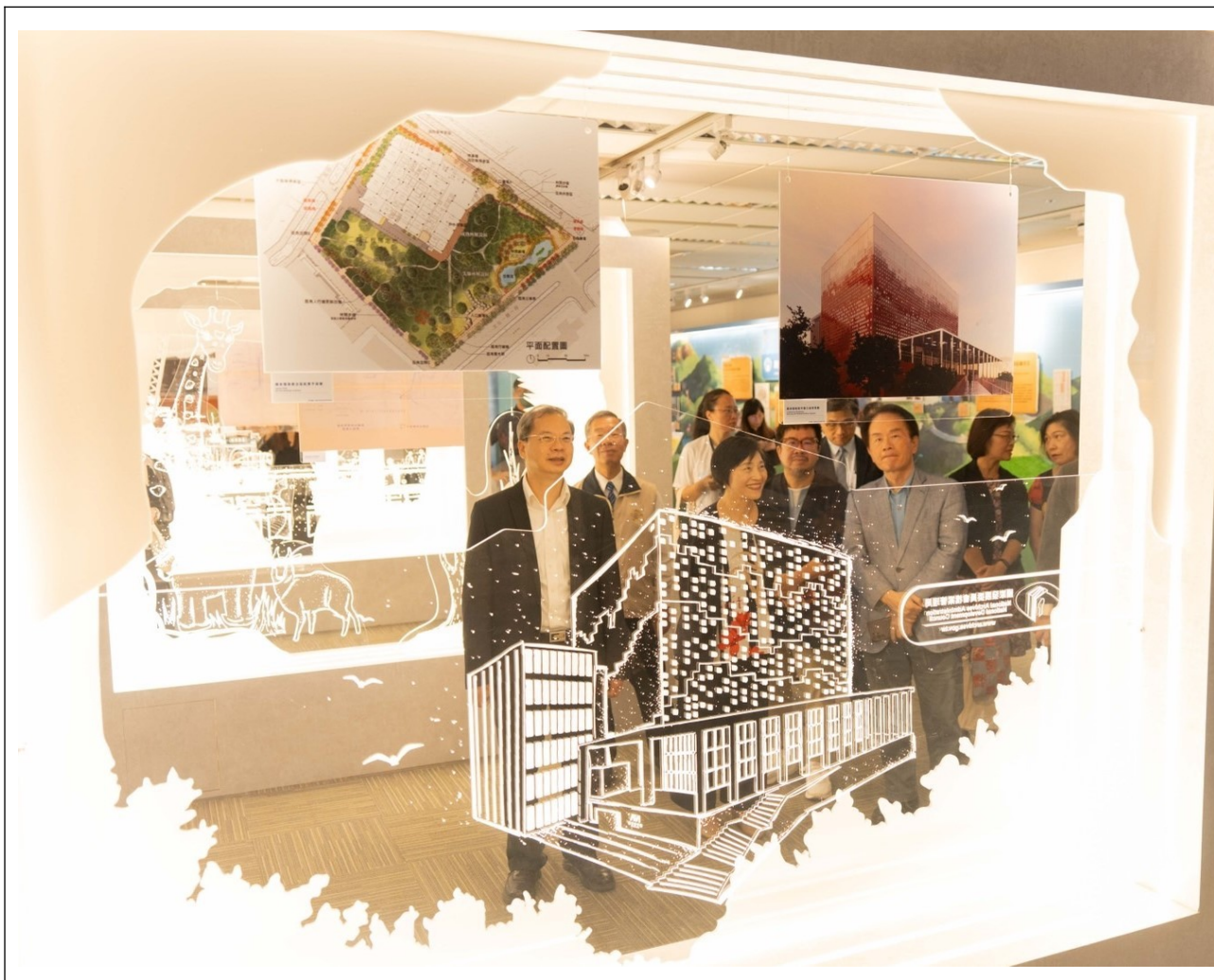
國家發展委員會主任委員龔明鑫(左1)及與會貴賓正在觀看「奇蹟之島—1970~1980 從開發到保育臺灣建設檔案特展」中島雷雕櫃—國家檔案館影像