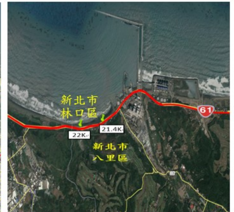
本計畫路段示意圖