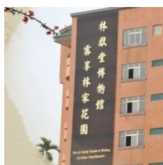
林家花園林獻堂博物