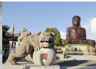
八卦山大佛風景區