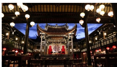
霧峰林家宮保第園區