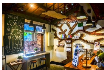
它好好 It's so good