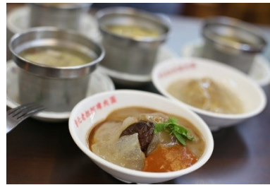
彰化經典美食小吃