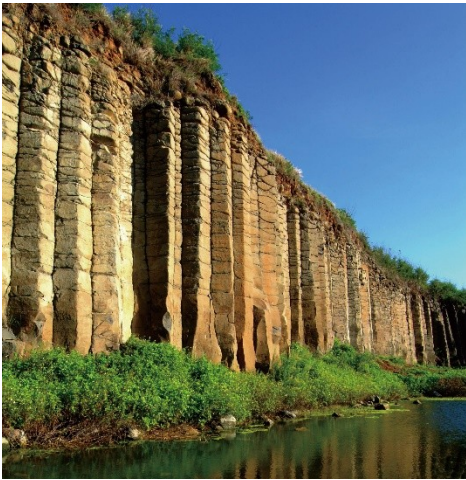
大菓葉柱狀玄武岩