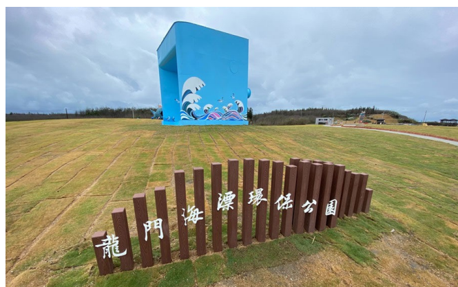
龍門海漂環保公園