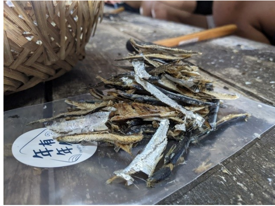
年年有鱈-敲魚乾體驗