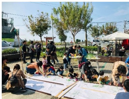
地利小食親子活動