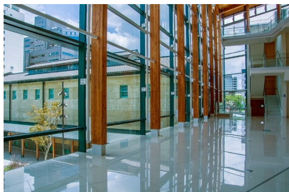
嘉義 市立 美術