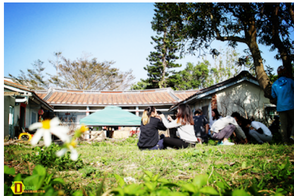
鼎農村試驗教育基地