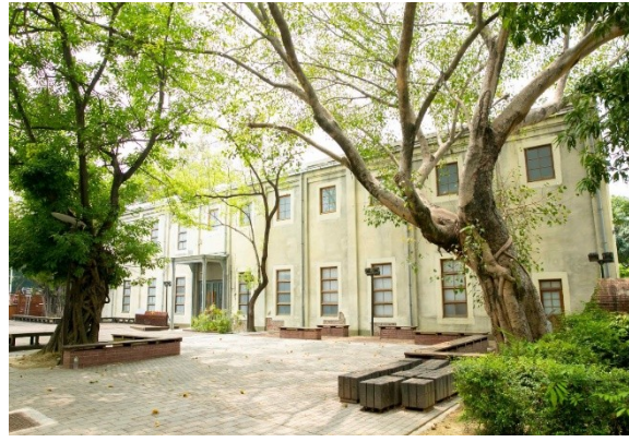
嘉義製材所－動力室