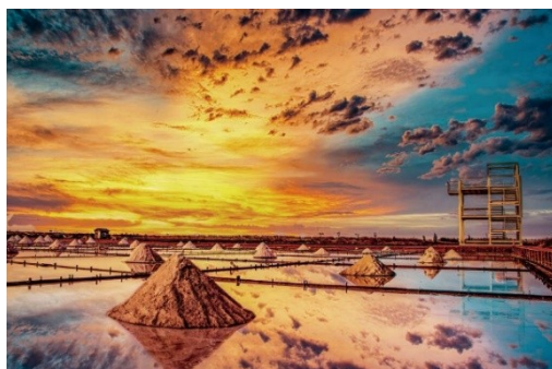
夕陽照下井仔腳瓦盤鹽田