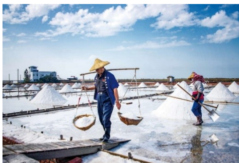
北門井仔腳瓦盤鹽田