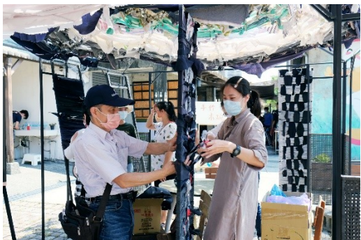
地利小食地方活動