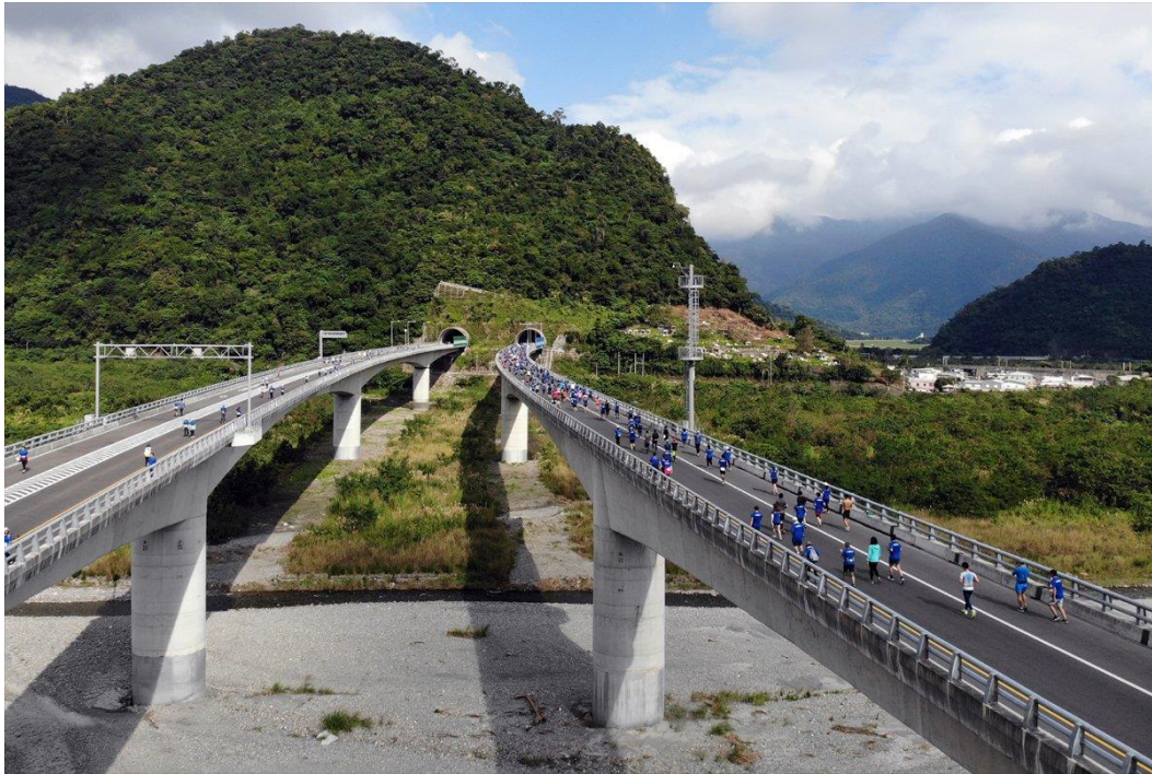
108年12月20日經濟日報報導蘇花改通車前舉辦馬拉松活動。