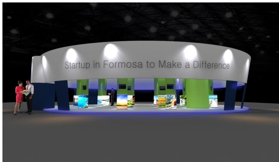
圖二、「Startup in Formosa to Make A Difference」新創國際館設計意象

去年國發會委託時代基金會 Garage+於 2015 臺北國際電腦展首度以巨石陣的意象設立新創館，共吸引超過 1 萬人次參訪，獲得國內外媒體 40 篇的報導。今年的設計將以天燈造型搭配景觀圖片，並以全 360 度的開放空間匯集人潮，讓國際訪客除了解臺灣的產業優勢外，也能體驗我國多元的特色文化與自然美景。