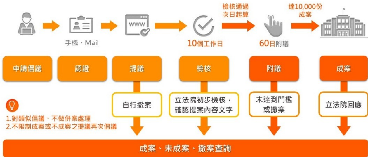
圖 2 立法倡議流程功能