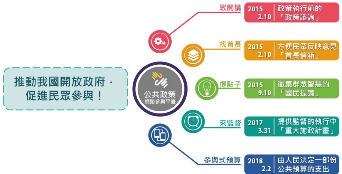
圖 1 公共政策網路參與平臺服務功能

參與平臺自 104 年 2 月 10 日起分階段依序提供政策形成前的「政策諮詢」（簡稱眾開講）；方便民眾反映意見之「首長信箱」（簡稱找首長）；計畫執行中供各界監督的「重大施政計畫」（簡稱來監督）；徵集群眾智慧的「國民提議」（簡稱提點子）；開放公民參與強化預算透明的「參與式預算」等 5 項網路參與服務功能。