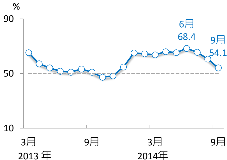
未來 6 個月景氣狀況指數