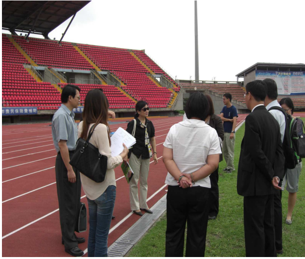
圖 5 查證小組現勘新竹縣體育場足球草皮整建情形