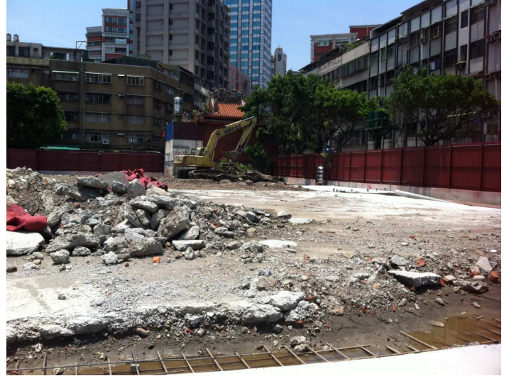
圖 1 查證小組現勘新北市板橋第一田徑場整建情形 圖 2 查證小組現勘新北市三重區國民運動中心基地情形