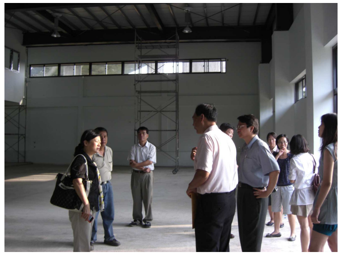
圖 3 查證小組現勘新竹市自由車場整修計畫情形 圖 4 查證小組現勘新竹市多功能競技館新建計畫情形