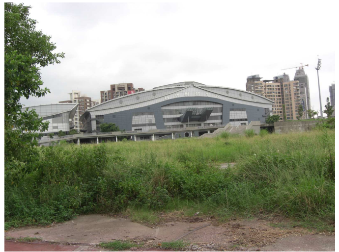
圖 6 新竹縣國民運動中心基地現況