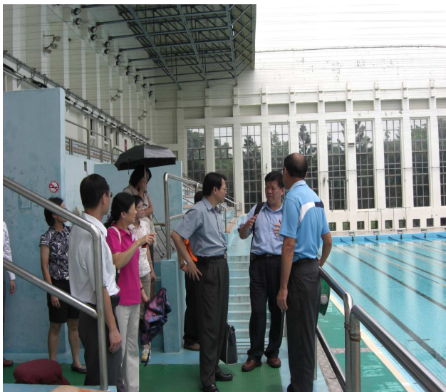
圖 7 查證小組現勘臺南縣綜合體育場冷改溫水游泳池情形