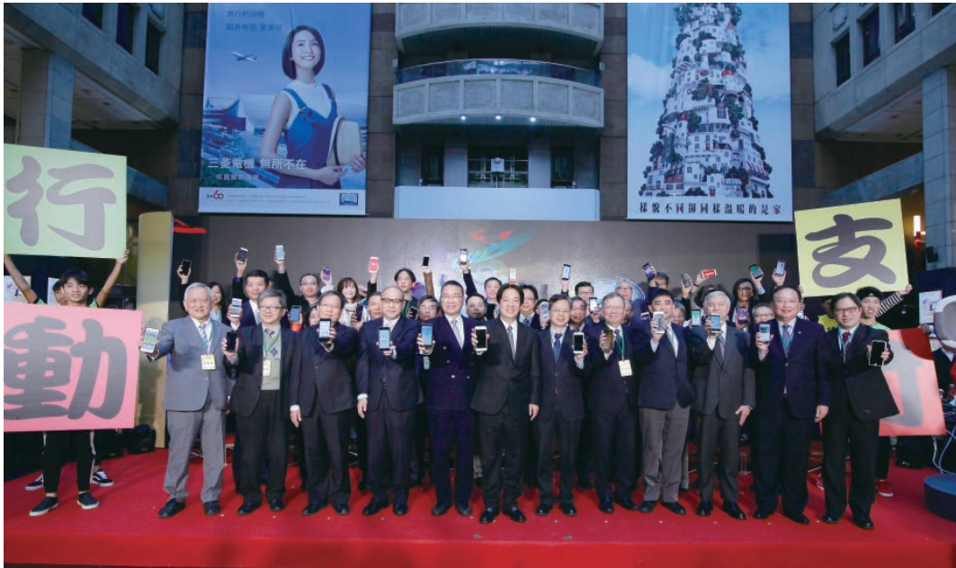
邱副主委陪同賴院長出席經濟部行動支付購物節活動。