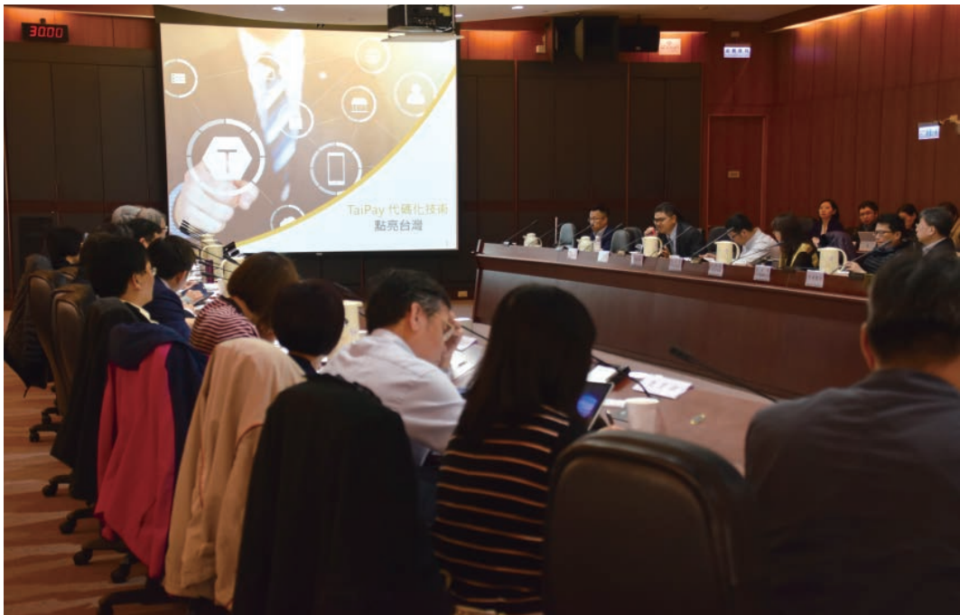
行動支付跨部會會議邀請兩家新創公司分享行動支付推動經驗。