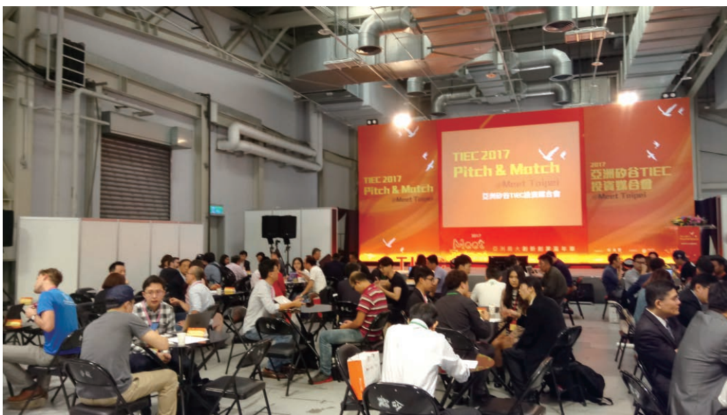
第三次資金媒合會@Meet Taipei。

另外，特別值得一提的是，此次媒合會與歐洲新創團隊——NetworkTables 合作，引進今年歐洲創業嘉年華（StartupFest Europe）的媒合系統，NetworkTables 能讓投資者與新創團隊於線上觀看彼此資料，即時安排媒合場次。而且投資者與新創團隊即便在媒合會結束後，也能夠相互送出「connect」邀請信，協助新創團隊建立人脈網絡。且截至 11 月 30 日為止，投資者與新創團隊又陸續透過媒合平台，建立了 25 次的「connect」。