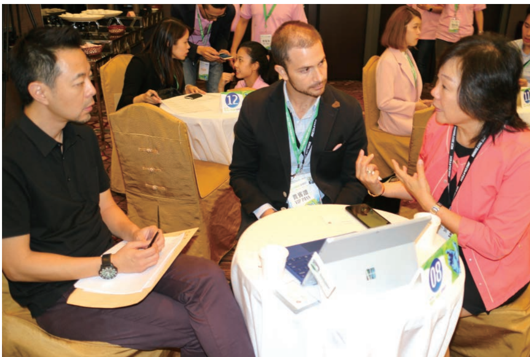
| 第二次資金媒合會@WCIT。

美國、日本、法國、新加坡、與馬來西亞，共 15 家投資者，進行 75 場次的媒合。第二次國際資金媒合會則結合 2017 WCIT 年會，在 9 月 11 日舉辦，此次資金媒合會有來自美國、英國、波蘭、瑞典、芬蘭、臺灣，共 34 組團隊參與，與來自美國、日本、新加坡、與臺灣，共 19 家國內外投資者，進行 55 場次的媒合。