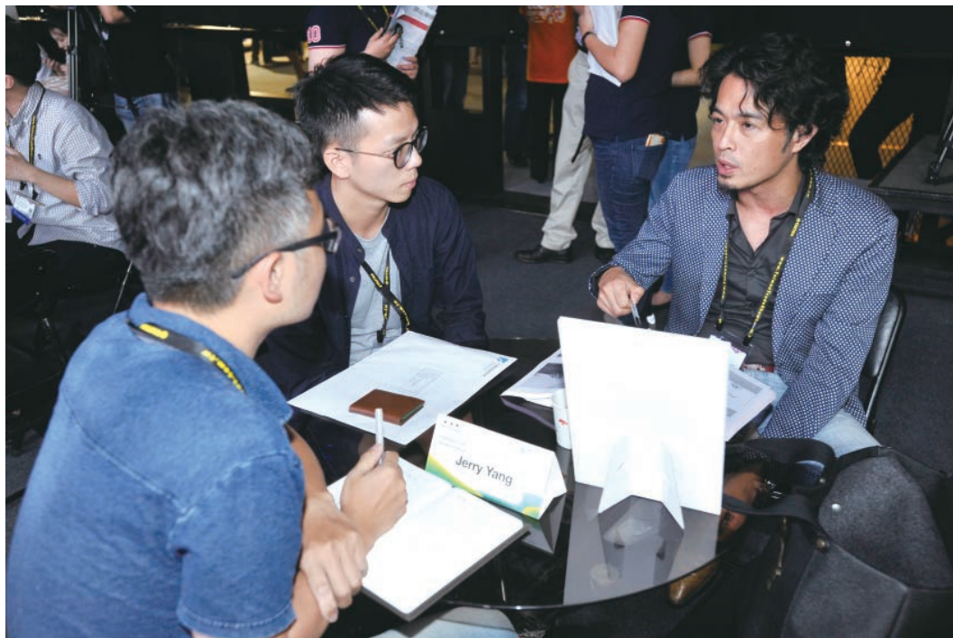
| 第一次資金媒合會@InnoVex。

第一次國際資金媒合會結合 InnoVEX（創新與新創展區），在 6 月 1 日於舉辦，總計有來自法國、瑞士、新加坡、與臺灣的 21 組團隊，與來自加拿大、