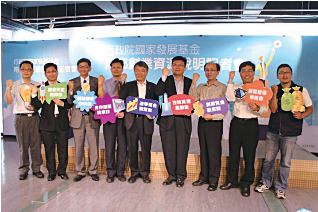
記者會與會貴賓合影