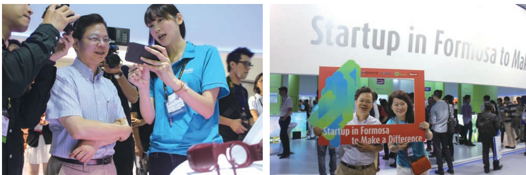
國發會龔副主委明鑫參訪今年國際館，並與時代基金會Garage+執行長趙如媛合照。

鑒於「亞洲矽谷計畫」為目前政府力推的重點政策之一，國發會龔副主委明鑫也親自來到 InnoVEX 新創展區現場，與國際新創團隊互動交流，並了解目前矽谷最重要的趨勢與科技。龔副主委表示，亞洲矽谷計畫比原有創新創業視野更廣，除了有國際交流空間、連結在地製造能量與美國矽谷之間形成 Ecosystem，更重要的是可以形成一個大型實驗場域，把北臺灣的創新能量從臺北到新竹整個串聯起來，形成創新聚落，將創新能量擴散開來。