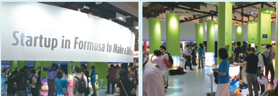
新創國際館外部及內部設計。

連續 3 天的「InnoVEX 新創展區」，讓世貿三館成為本屆臺北國際電腦展的最受矚目的展館，延續去年高人氣的新創主題館，國發會與時代基金會 Garage+ 今年以「美麗之島 創業天堂 - Startup in Formosa to Make a Difference」新創國際館，號召國際優秀新創團隊一同參與，運用 360 度環景天燈造型搭配臺灣特色人文景觀的設計，再次抓住所有參觀者目光。展覽現場人潮絡繹不絕且成績斐然，共吸引超過 10,500 人次參觀，並獲國內外媒體超過 85 篇的報導，成功把臺灣新創能量推向國際舞臺，同時也藉由此次邀請國外新創來臺，觸及國內產業與新創社群，將臺灣的創新創業氛圍帶到最高點。