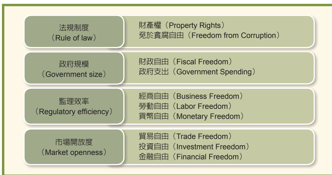
圖3 《經濟自由度指數》評比指標

基於保障個人勞動選擇及財產處分之經濟自由可促進社會整體繁榮發展之宗旨，《經濟自由度指數》聚焦於 4 個典型受政府政策影響及控制的層面，包括法規制度、政府規模、監理效率及市場開放度，並進一步依據 10 項指標評估各個國家及經濟體之經濟自由程度。