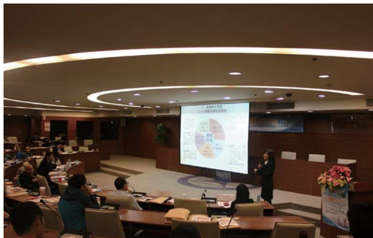
圖 3 國發會鄭佳菁專門委員業務分享