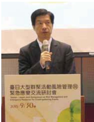
圖 1 行政院葉欣誠政務委員代表行政院致詞

國發會負責國家整體發展之規劃、設計、協調、審議及管考等業務，面對急遽變遷的國內外情勢，從國家永續發展、資源統籌規劃的視野與高度，協調推動重大政策，除經濟發展外，同時關注社會發展議題，期能發揮國家發展策