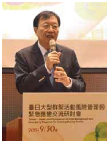
圖 3 內政部陳威仁部長致詞