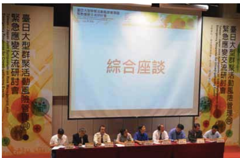
圖 5 與會學者專家與參加研討會人員綜合座談