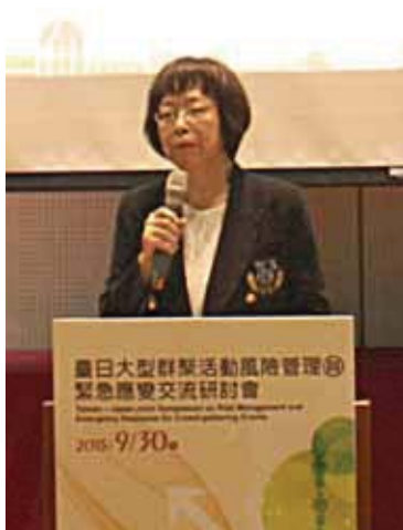
圖 2 國發會曾雪如主任秘書開幕致詞