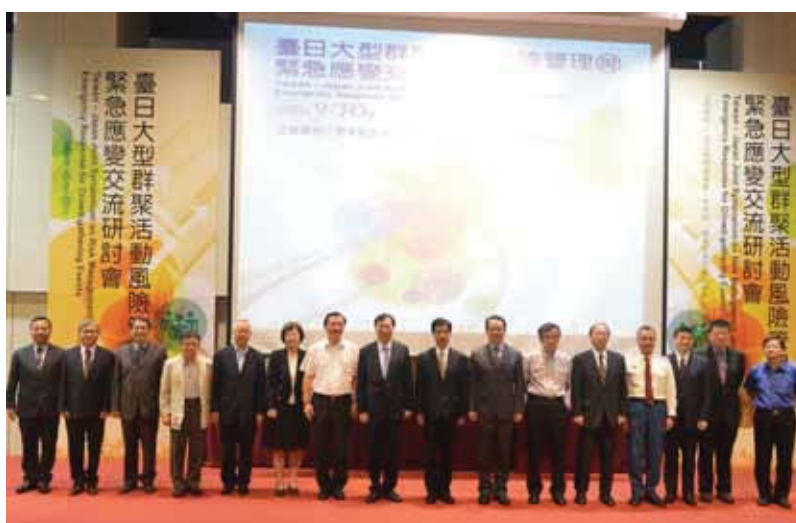
圖 6 臺日學者專家與行政院葉欣誠政務委員、國發會曾雪如主任秘書合影

李清安副局長等學者專家，也從今年 627 八仙樂園發生塵爆事件之應變、復原、大量傷病患緊急處理、救治與醫療資源調度，以及災害預防等分享經驗、進行研討，現場並開放問題詢答及與會人員綜合座談，在熱烈互動中圓滿閉幕。