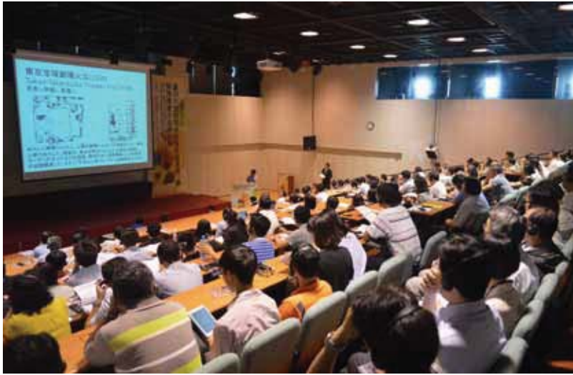
圖 4 日本專家長谷見雄二教授專題講授