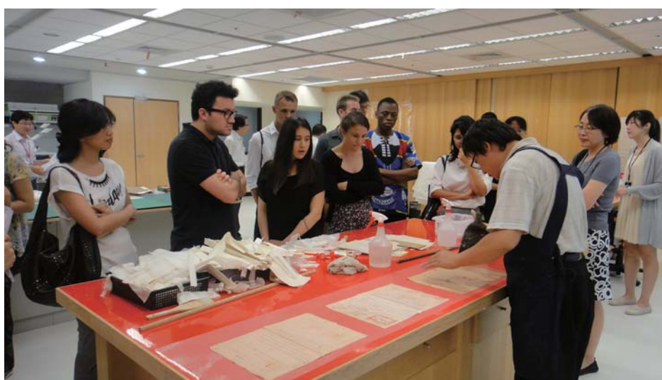
圖 2 外籍實習生參訪檔案局瞭解檔案修護情形