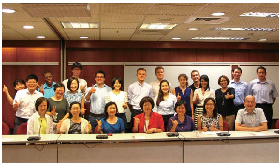
圖 3 外籍實習生報到及業務說明會合影