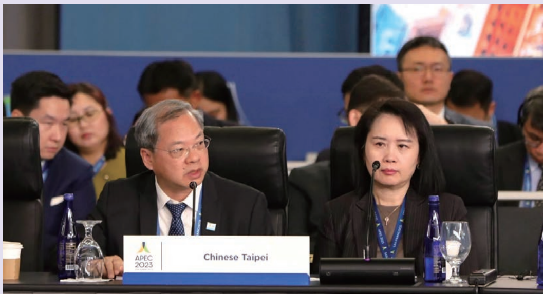
國發會龔主委明鑫於AMM會議發言

國發會龔主委明鑫及行政院鄧政務委員振中共率我方代表團出席 2023 年 11 月 14 至 15 日於美國舊金山召開之亞太經濟合作（APEC）年度部長級會議（APEC Ministerial Meeting, AMM），並正式發布 APEC 部長聯合聲明（Joint Ministerial Statement）。另為探討全球因應氣候變遷所帶來的挑戰，國發會擔任我國 APEC 經濟委員會（EC）及人力資源工作小組（HRDWG）的窗口，分別主辦「綠色轉型下之公正轉型」（Toward a Green and Just Transition）政策對話及「APEC 2023 淨零經濟時代下創造新就業機會論壇」（2023 APEC Forum on Creating New Employment Opportunities in the Era of Net-Zero Economy），與 APEC 會員體交流淨零轉型之綠色就業及公正轉型的議題。