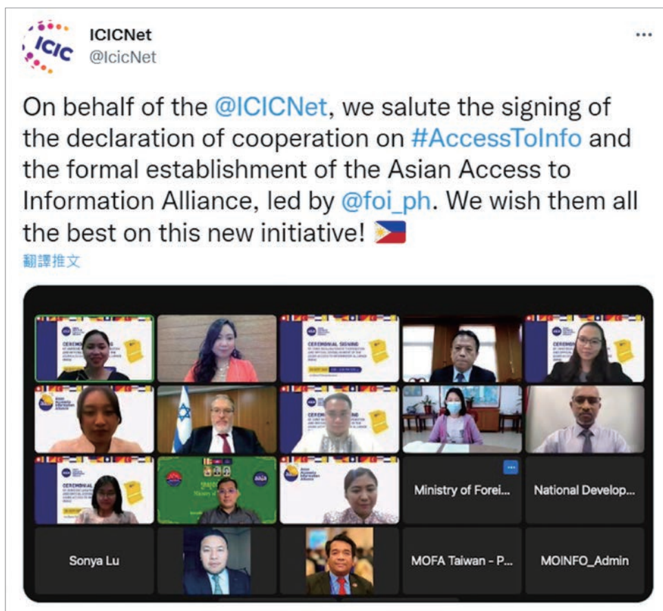
ICIC於Twitter發布AAIA成立相關貼文

未來菲律賓與各創始會員國將就 AAIA 章程、年會辦理等事項進行討論，作為我國創始會員國代表，國發會將持續協同外交部等相關單位參與 AAIA 相關工作，促進與亞洲區域內的合作與交流，並掌握機會與各相關議題的國際聯盟進行橫向聯繫，致力提升我國國際多邊參與。🌐