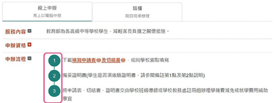
圖 4 申辦流程之改造前後對照

教育部國民及學前教育署主管高級中等學校特殊身分學生學雜費減免及就學費用補助 發佈單位:教育部國民及學前教育署