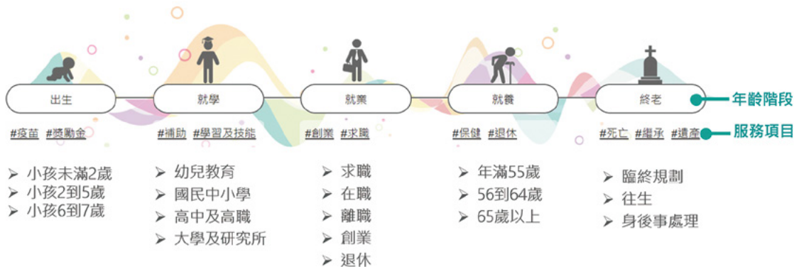
圖 2 我的 E 政府陪伴你人生重要階段 - 以年齡階段 + 服務項目呈現

過往民眾需分別至各機關網站查找所需服務，現在「我的 E 政府」以主題式串連與推薦跨機關服務，彙整關鍵服務資訊，例如「輕鬆養，輕鬆領！9 個給新手爸媽的育兒服務大集合」、「大專院校學生可以申請那些獎助學金？政府一次整理給你看看！」、「失業該怎麼辦？4 大失業相關補助一次整理給你看看！」、「建立友善職場，雇主必看的補助方案一次報你知！」、「找外籍看護很緊張？重要資訊政府幫你整理好！」、「親友離世之後，需要處理哪些事情？」等主題策展，讓目標受眾 (Target Audience, 簡稱 TA) 看見政府服務全貌，一目了然與自己目前狀況相關服務，進而選擇所需服務。