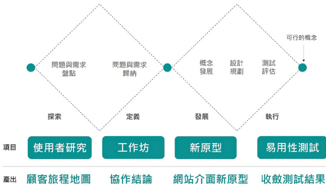
圖 1 運用雙鑽石設計模型進行「我的 E 政府」服務設計改造

國發會突破過往以政府業務掌職為中心的框架，導入以使用者需求為中心，進行使用者研究，開放多元利害關係人（如服務提供者 - 政府機關、服務使用者 - 民眾、服務設計專家、平臺開發廠商等）參與協作、並透過使用者易用性測試、Google Analytics 數據