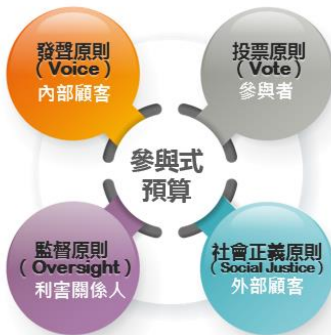
圖1：參與式預算理想制度四大原則 5

由上述說明可以知道理想的參與式預算四大原則包括了發聲原則（Voice）是屬於內部顧客，是代表對於預算案最有直接相關；而投票原則（Vote）則是來參與投票的投票者，表示對預算案有興趣的；監督原則（Oversight）則是表示利害關係人；而社會正義原則（Social Justice）則是為實際受益的外部顧客。本研究要藉由績效評估指標來探究參與式預算的目標客戶群使用參與式預算後的認知、看法及效益，透過客觀、可衡量的績效指標來評估參與式預算的實際施作效益（圖 1）。