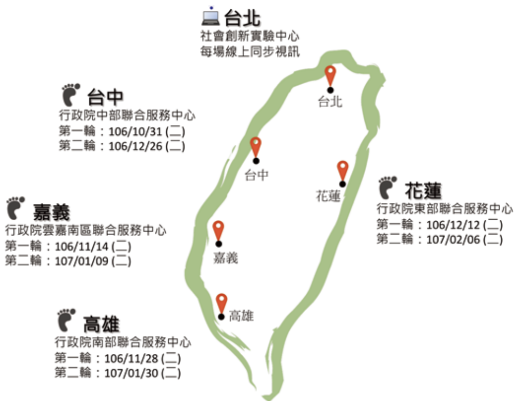
圖 1 社會創新行動巡迴座談場次