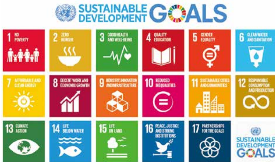
圖 1 聯合國的永續發展目標與高等教育結構融合

際組織紛紛思考如何透過政策工具的創新來引導高等教育結構的變革，孕育大學的多元型態，讓大學能分類發展，並在各項重大議題的創新能更接地氣、更有感，甚至與聯合國的永續發展目標（Sustainable Development Goals, SDGs）相互呼應，如圖 1。國際大學校長協會（International Association of University Presidents, IAUP）號召全球大學將 17 項永續發展目標和公民意識的理念融入教學、研究、