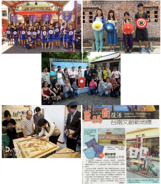
圖 3：進駐團隊與市府合作專案