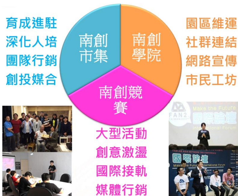
圖 2：園區執行三大面向