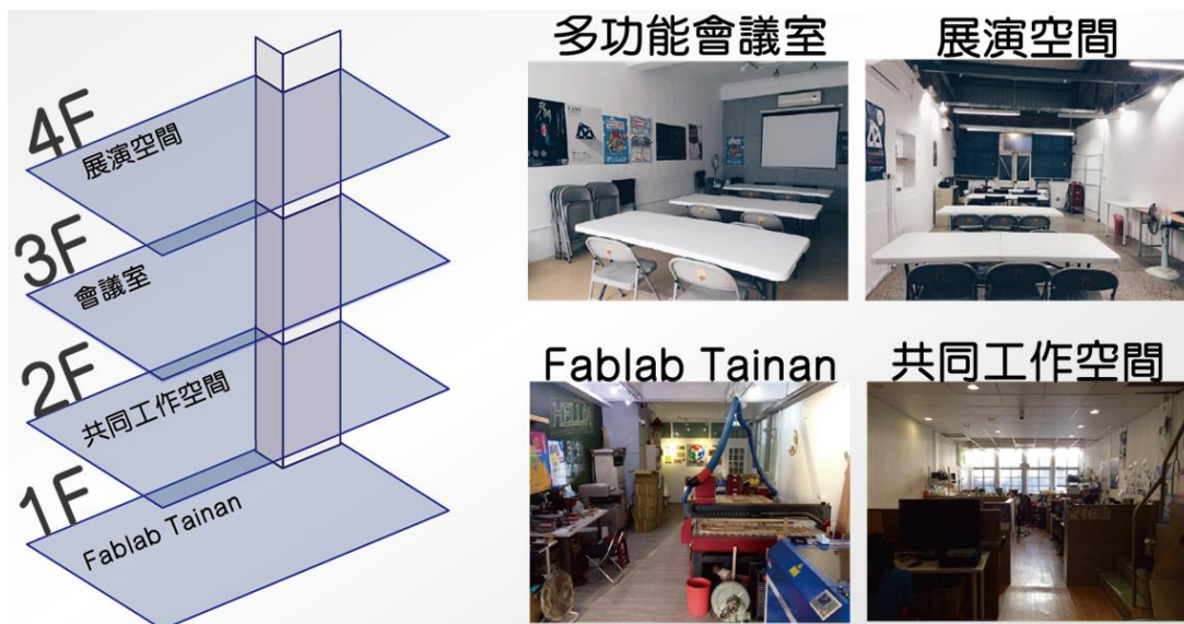
圖 1：臺南數位文創園區各樓層配置圖