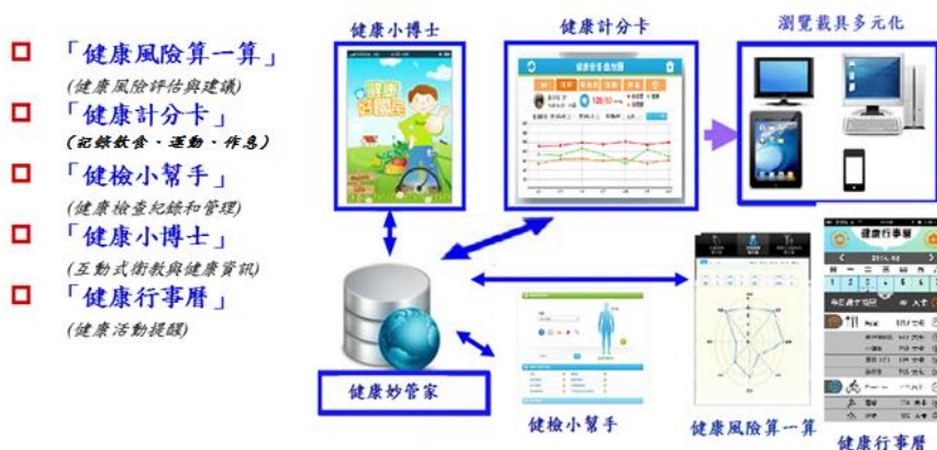
圖 II.3.1 健康妙管家