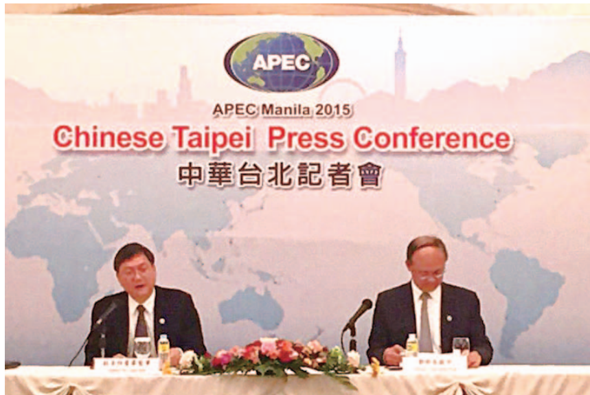
杜主委與鄧部長於AMM 2015雙部長記者會。

成 APEC 平衡、包容、創新、永續、及安全成長的願景。大會最後通過年度部長聲明，總結 APEC 今年推動四項優先領域相關工作的成果，並就領袖宣言及相關附件草案交換意見，送交 11 月 18 ~ 19 日召開之 APEC 經濟領袖會議 (AELM) 採認。