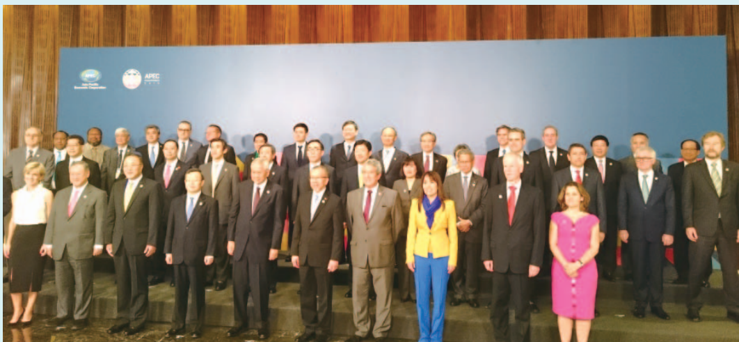
▲ APEC會員體部長們合影留念。

本屆APEC年會主題為「建構包容經濟、打造美好世界」，將聚焦討論「強化區域經濟整合議程」、「促進微中小型企業參與區域及全球市場」、「投資人力資本發展」，以及「建構永續與韌性的社群」等四大優先領域議題。此外，主辦會員體菲律賓更提出「強化APEC優質成長策略」，該策略係奠基於「2010年領袖成長策略」，期藉由制度建立、社會融合、以及環境影響等三大關鍵責任領域，達