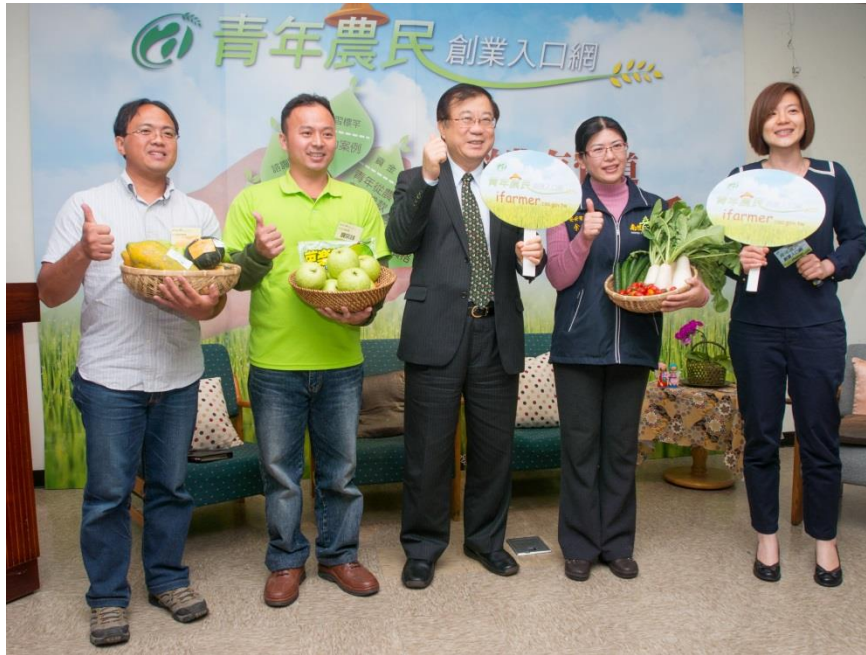
圖3：青年農民創業入口網啟動記者會