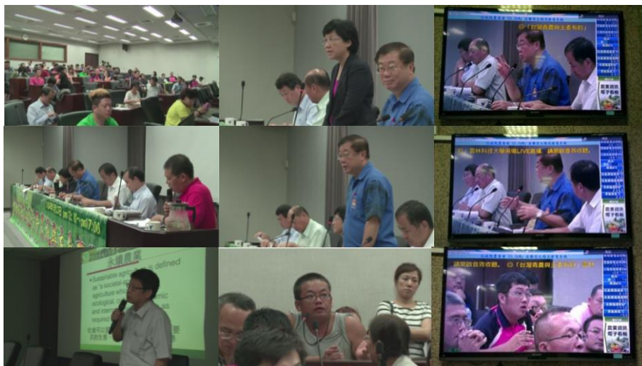
圖4：青年農民與主委有約論壇交流情形