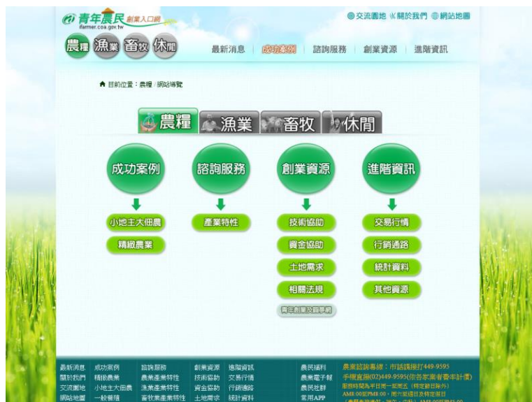
圖 2：青年農民創業入口網-首頁

整合農業訓練、農地取得、資金籌措、生產經營技術及行銷等各面向資訊，提供一站式查詢服務及農業客服諮詢服務，建置「青年農民創業入口網（ http://ifarmer.coa.gov.tw/ ）」（如圖 2），另本會「農地銀行（ http://ezland.coa.gov.tw/ ）」網站擴增提供國有耕地放租及退撫會、臺糖租賃土地資訊，成為農地管理中心，讓從農初期的青年農民得以現代化觀念與認知穩健經營農業，提升經營管理。運用資通訊技術平臺擴大青年農民專案輔導成效，透過青年農民網路社群並結合各縣市青年農民輔導，發揮青年農民群聚效益，挺小農創大業。