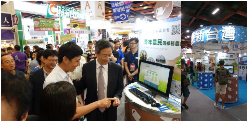
圖 5：參展 2015 臺北國際軟體應用展-網站展示