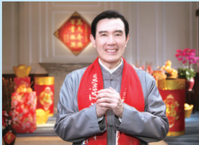
總統發表除夕談話，祝福國人萬馬奔騰，百業振興！

各位親愛的鄉親， 各位電視機前的朋友， 我是馬英九。在這裡要向各位拜個早年，祝福大家，新年愉快，萬事如意！