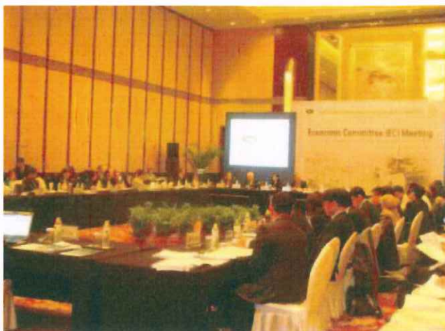
| APEC經濟委員會第一次會議 (EC1) 實境。

(四) 經商便利度 (EoDB) : 進行 EoDB 政策討論，包括近年之推動進展、檢討進展緩慢原因、如何加強改善等，並針對是否持續推動本倡議與會員體進行討論。