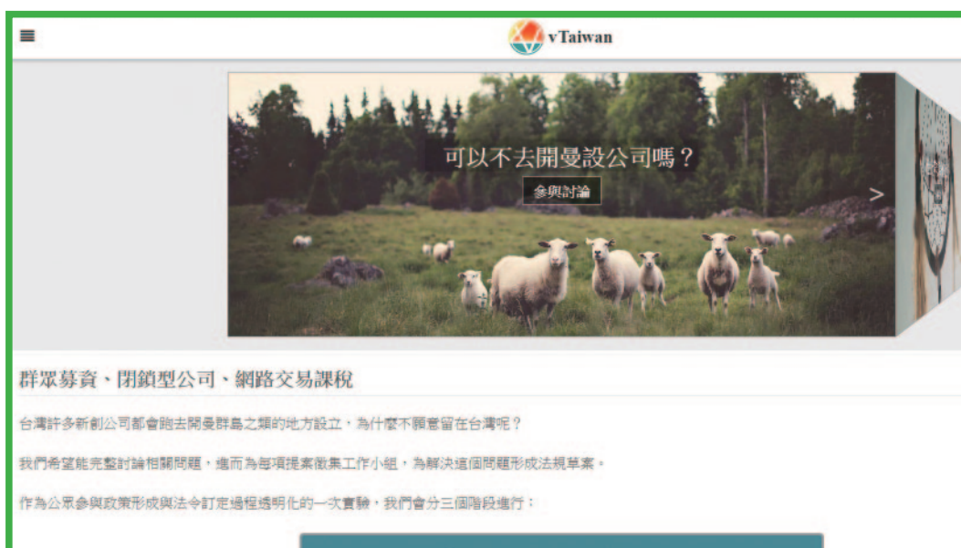
圖2 虛擬世界法規調適相關議題民間諮詢平台

效應並有利於網路族群了解會議進行，線上諮詢會議皆於晚上舉辦，且於每場次會議辦理前，先行公告當日相關簡報資料，並透過 vTaiwan 諮詢平台蒐集意見，透過網路直播模式，釐清相關問題與疑慮，強化政策溝通，減少政策與民意落差。