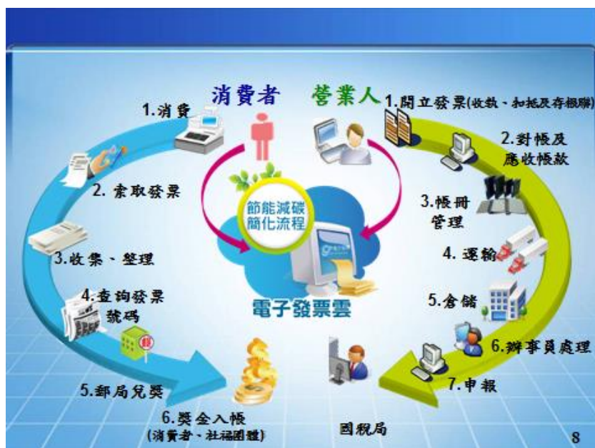
圖 2 B2C 交易消費及發票流程圖

特殊的，其主因是在臺灣有很多的社福團體，其經費來源是依賴消費者所捐贈發票的中獎獎金。