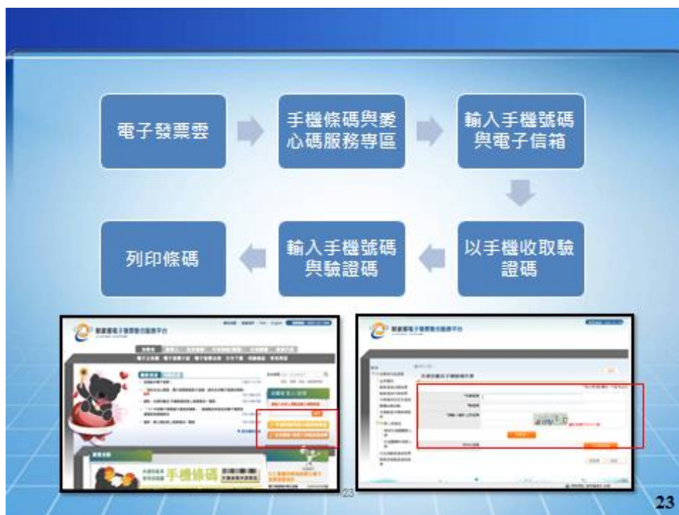
圖 3 手機條碼申請流程

除了使用手機條碼索取電子發票外，亦可將各種載具歸戶在手機條碼下，進行金融帳戶設定，於統一發票開獎後，系統將會自動幫消費者對獎，並以電子郵件通知中獎訊息，中獎獎金亦會自動轉入消費者帳戶。