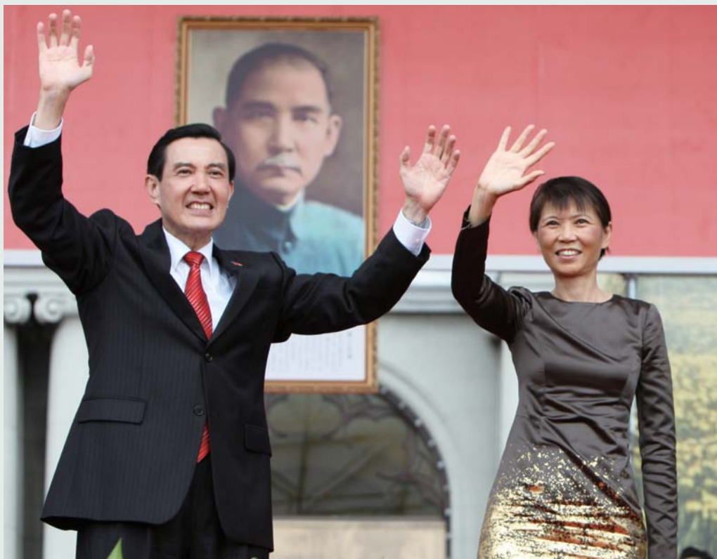
馬英九總統偕同夫人周美青女士於10月10日上午，出席在總統府前廣場舉行的「中華民國中樞暨各界慶祝99年國慶大會」。