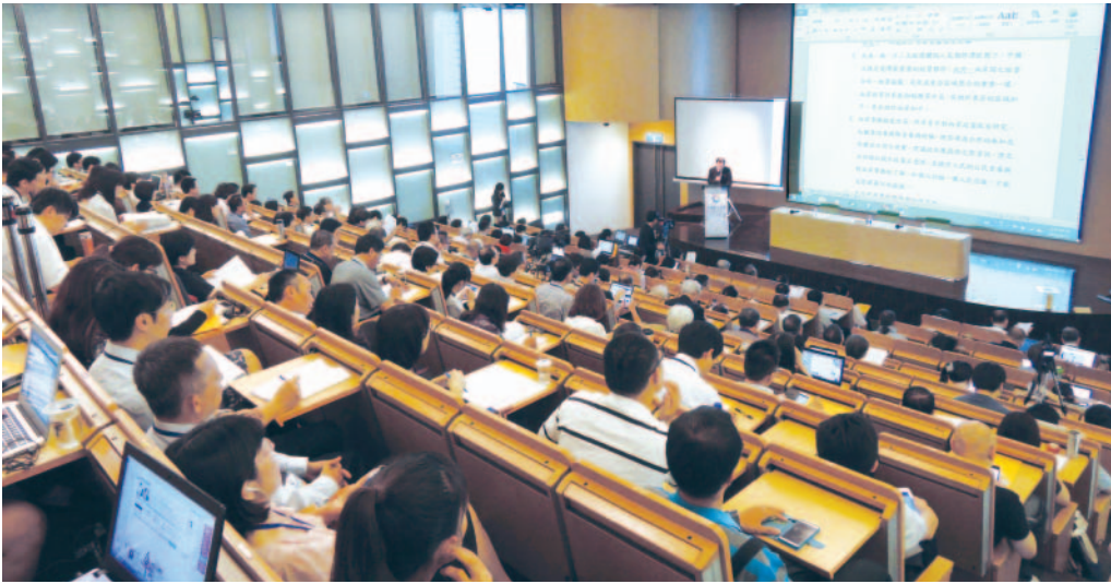
北區會議王健全副院長宣讀主軸議題二之綜整意見。

關於在地型產業，與會代表普遍表示政府應考量當地產業優勢、地方需求及文化脈絡，訂定適當的在地產業發展政策，輔助發展小而美、具在地特色的產業；同時，協助在地產業行銷，推廣至國際。