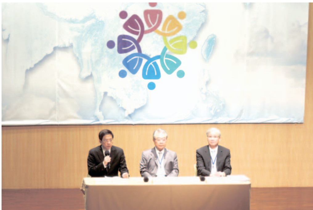
北區會議管中閔主委進行致詞（由左至右依序為管中閔主委、許勝雄理事長及楊泮池校長）。

張部長在致詞時強調，區域經濟整合已為全球趨勢，台灣處於不能被邊緣化之關鍵時刻，尤其兩岸經貿以及幾個大型的經濟整合更攸關台灣未來發展。黃校長表示全球經濟面臨重大轉變，台灣在巨變中必須思考活路，期許本次會議藉由多元意見之表達，提供政府有效的參考及方向。楊校長表示本次會議係由南部觀點提供區域經貿整合的意見，企盼與會代表能暢所欲言，讓南部的聲音與需求納入政府的施政考量。