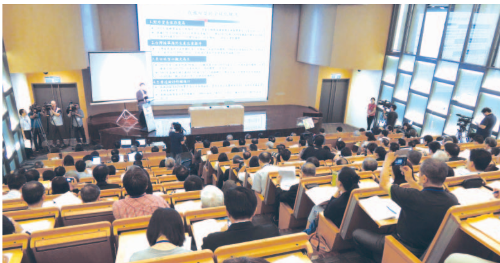
北區會議龔明鑫副院長進行引言報告，台下代表聚精會神聆聽。

龔副院長對於全球化發展下之經濟現象，及我國產業、就業與所得遭遇的全球化挑戰，都進行了精闢分析，並提出我國因應全球化之 4（產業）+ 1（勞工）策略：加速產業升級轉型、鼓勵微型創業、發展在地經濟、培植社會企業及強化勞工保障與協助。王副院長則簡要概述了全球區域經貿整合趨勢與兩岸經貿對加入區域經貿整合的重要性，並對台灣加入區域經貿整合具體作法提出建言，包括建立社會共識、強化戰略規劃、訂定行動方案確實執行、讓自由貿易利益由全民共享，及產業升級與結構調整等。