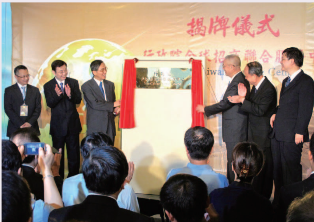
行政院全球招商聯合服務中心於8月8日正式揭牌成立。