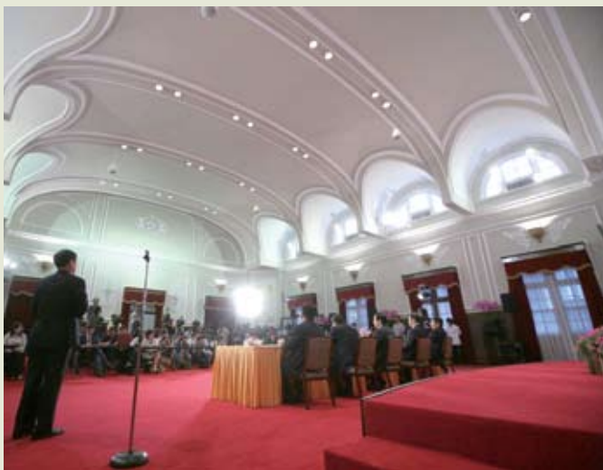
馬總統施政週年，媒體均藉此時機檢視一年來的成果。

況應該在改善之中。但是我們也要提出警告，今年6、7月大學畢業生可能會帶來新一波的失業潮，因此我們還要有準備，苦日子還要撐一段，但是到了今年下半年，第三季、第四季，我們相信情況會有比較顯著的改善。