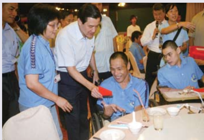
為落實社會公義、照顧弱勢團體，行政院已陸續實施勞保年金、國民年金等相關制度。

18. 通過「漢生病患人權保障及補償條例」，已發放病友（或遺屬）補償（撫慰）金計約6億8,218萬元，並辦理漢生病正名、回復漢生病友名譽，修繕居住環境，提供樂生療養院所有院民妥善的醫療及安養照護。