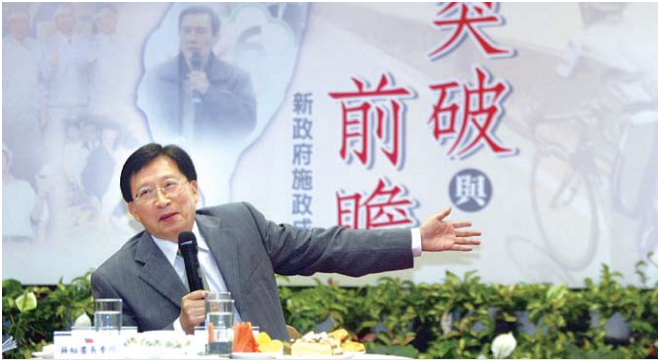
行政院長劉兆玄在施政滿週年前夕，舉辦記者會回顧這一年的施政成果。