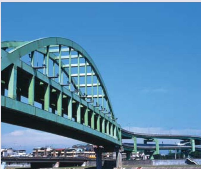
「愛台12建設」從各種軟硬體著手，改善台灣的發展體質。

關於眾所矚目的「桃園航空城」建設，我們已經公布施行「國際機場園區發展條例」，規劃成立國營國際機場園區股份有限公司進行經營。事實上，等到第一航廈改善工程完工之後，大家就會看到一個嶄新的、氣派的國家門面，讓我們可以迎接來自世界各地的訪客。