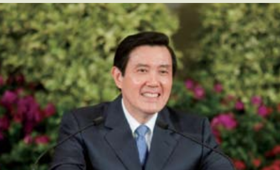
President Ma attended the Press Conference.