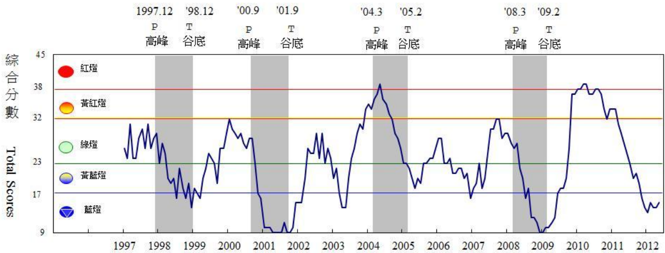
圖 7 歷年景氣對策信號走勢圖

綜合判斷說明：●紅燈(45-38)，●黃紅燈(37-32)，●綠燈(31-23)，●黃藍燈(22-17)，●藍燈(16-9)。 註：各構成項目均為年變動率，除股價指數外均經季節調整。