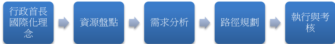
圖 02 行政流程圖