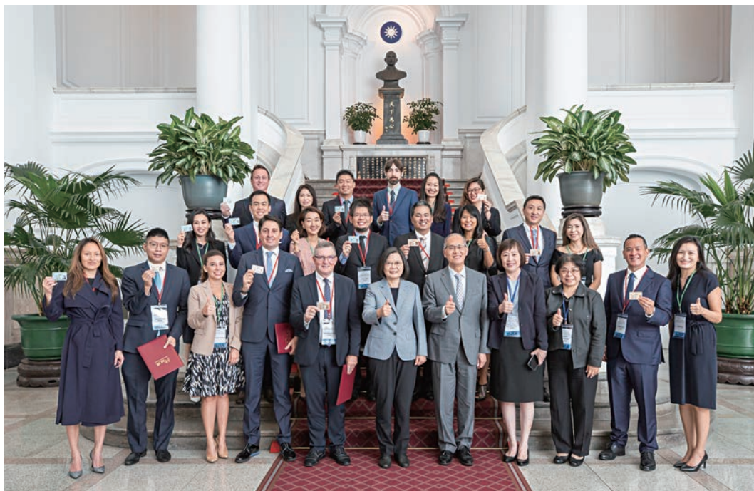
109年9月28日蔡總統英文於總統府接見第1,000張就業金卡持卡人。

臺灣正值國家經濟發展與產業轉型的關鍵時刻，5+2 及六大核心戰略產業人才需求孔亟，加上後 Covid-19 時期全球產業供應鏈重組，也牽動國際人才板塊的變動，提供臺灣國際人才延攬契機。蔡總統近期表示：現在是臺灣百年難得一見的機會，所以一定要把握這個機會，政府希望創造更優質的環境，讓國際人才聚集在臺灣，「臺灣成為下一個矽谷，不該是問號，要是驚嘆號。」