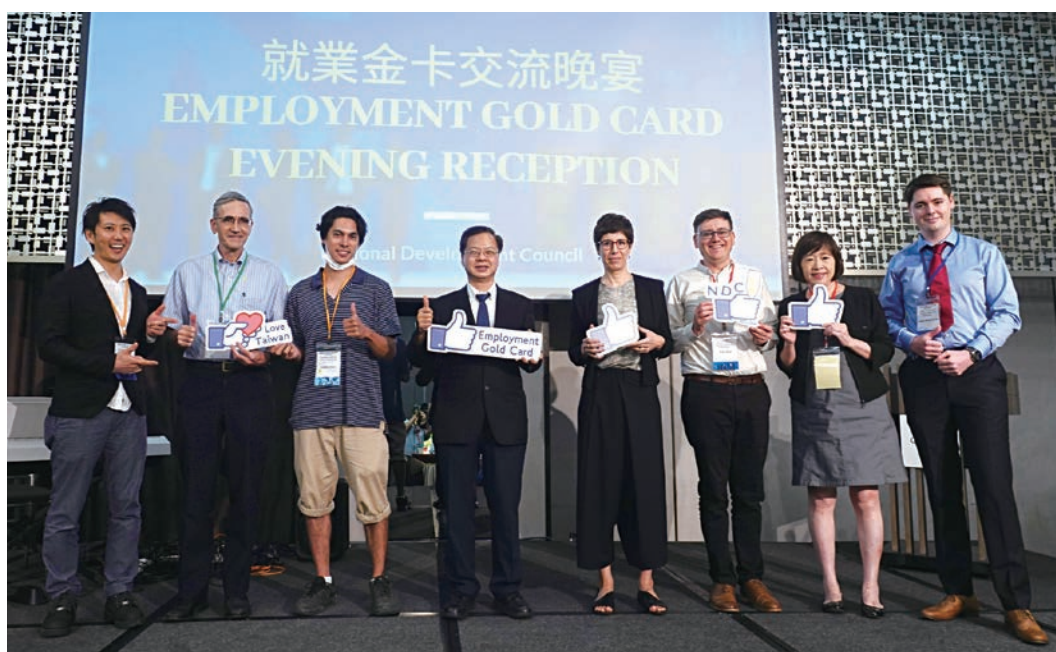
國發會龔主委明鑫、高副主委仙桂於就業金卡交流晚宴與就業金卡持卡人合影。

為加強延攬及留用外國專業人才，以提升國家競爭力，國發會自 107 年 2 月推動施行《外國專業人才延攬及僱用法》，至今已獲致相當成果，尤其針對高階外國特定專業人才所核發之四證合一（包括工作許可、居留簽證、外僑居留證及重入國許可）「就業金卡」，允許持卡者在臺可自由尋職、工作或創業，該制度推動至今廣受好評，截至本（110）年 3 月底計核發 2,447 張，其中 109 年度核發 1,399 張，為外國人才專法開始實施至 108 年底（23 個月）累計核發 546 張之 2.6 倍，呈現大幅躍升，成功吸引「矽谷臺灣幫」新創人才，以及資通訊、資安、生醫、航太及文化等產業頂尖關鍵人才來臺發展。