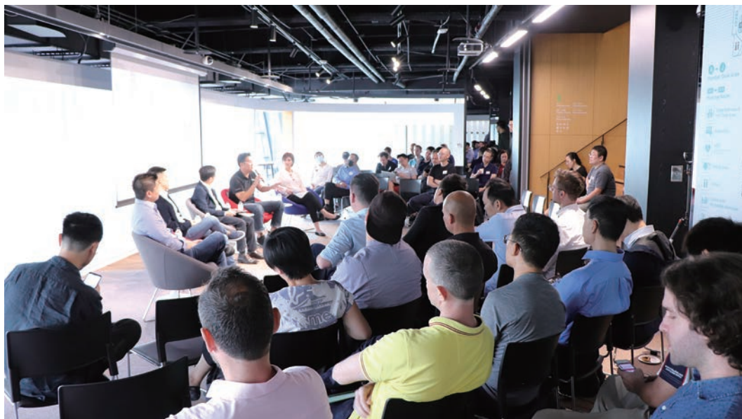
109年11月2日「What Resources are Available for you」介紹臺灣的新創資源交流活動。