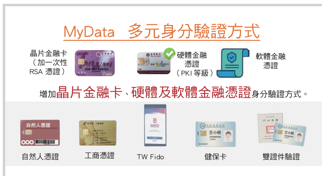
圖 2 MyData 多元身分驗證方式

務。另本平台已增加身分驗證方式，除目前已有自然人憑證、工商憑證、TW FidO、健保卡、雙證件驗證等身分驗證方式外，考量民眾為辦理金融業務，多備有晶片金融卡或軟體憑證，且金管會與轄管金融業者在金融卡及憑證之申辦及管理也相當嚴謹，故本平台增加晶片金融卡、軟體及硬體金融憑證等驗證方式，並將晶片金融卡搭配一次性憑證進行電子簽章提升安全等級，以普及民眾使用率及增加身分驗證便利性。