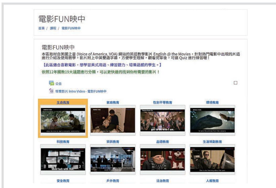
圖 1 Cool English 聽力課程——電影放映中