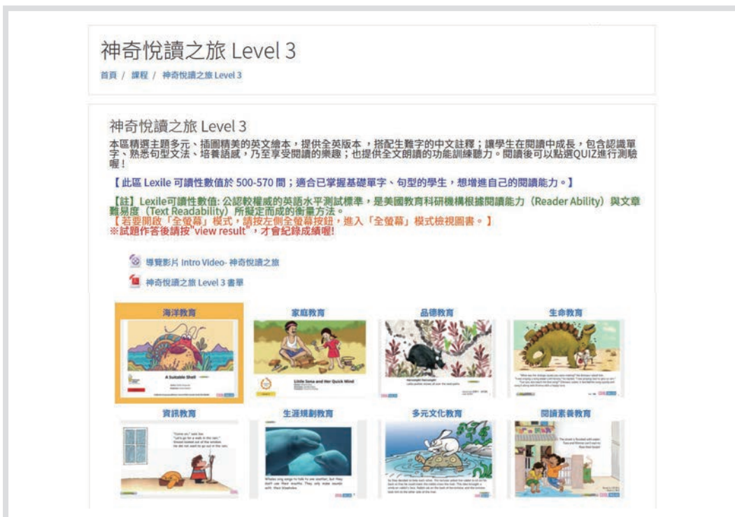
圖 3 Cool English 閱讀課程——神奇閱讀之旅