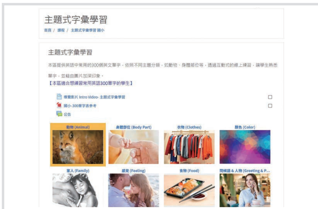
圖 5 Cool English 字彙課程——主題式字彙學習