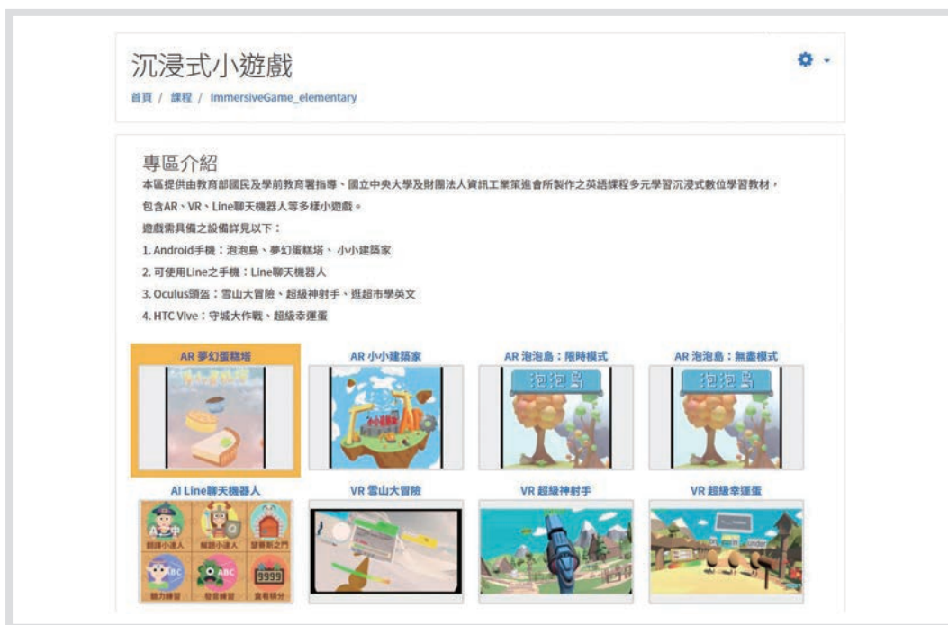
圖 7 Cool English 遊戲課程——小遊戲