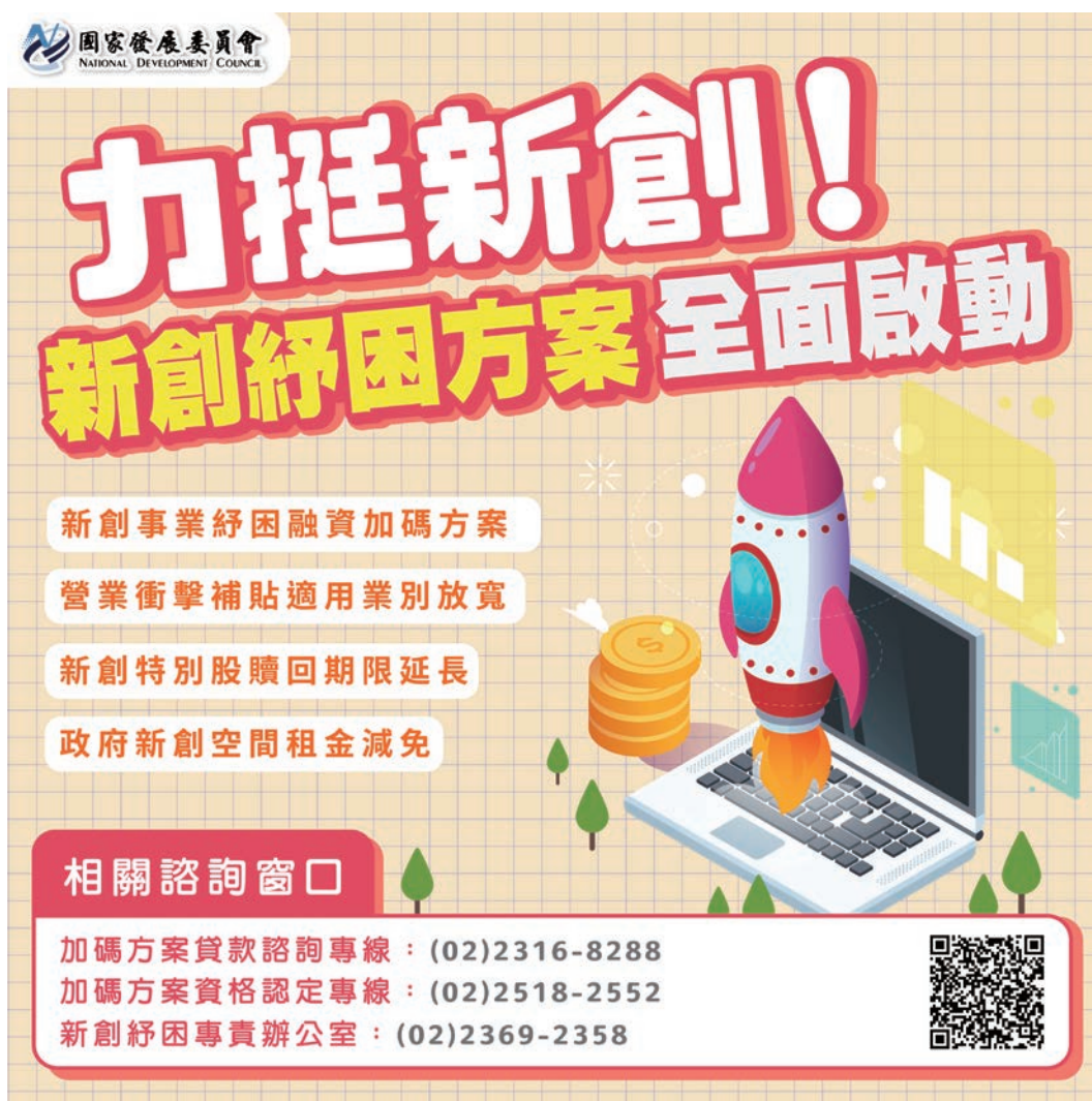
圖 4 新創紓困方案宣傳

國發會表示，未來將持續協調國發基金、經濟部、科技部等相關單位，依國內疫情影響的狀況及新創實際需求，滾動檢討相關紓困措施，協助國內新創事業挺過此次難關。待疫情趨緩後，國發會也將與新創社群緊密合作，透過「亞洲·矽谷 2.0」精進做法，協助具潛力之新創事業加速發展，以爭取後疫情時代新興商機。