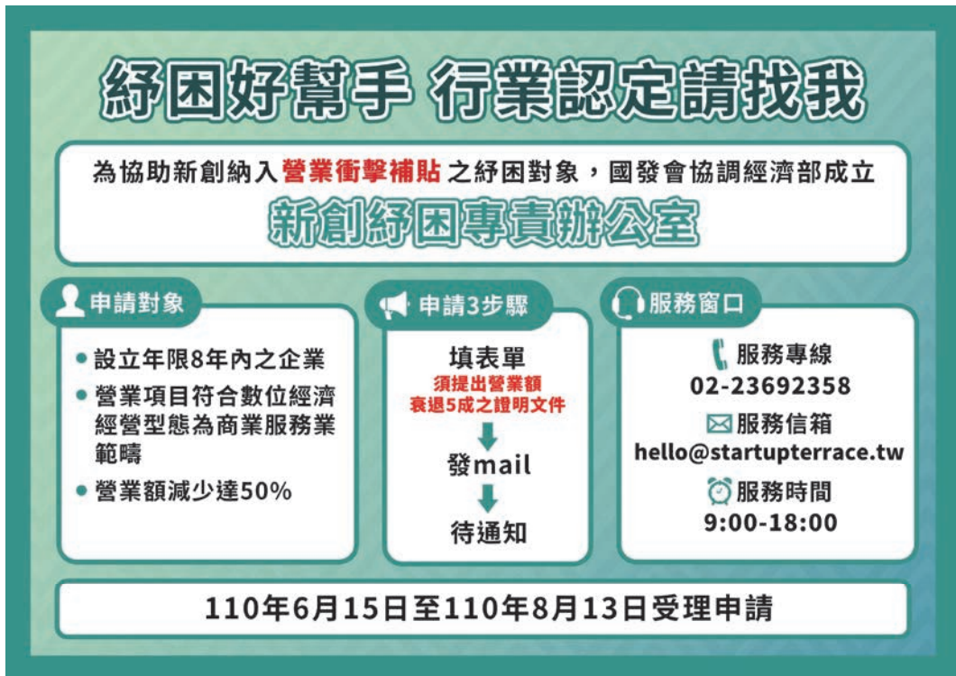
圖 3 「新創事業紓困專責辦公室」之服務對象及作業流程