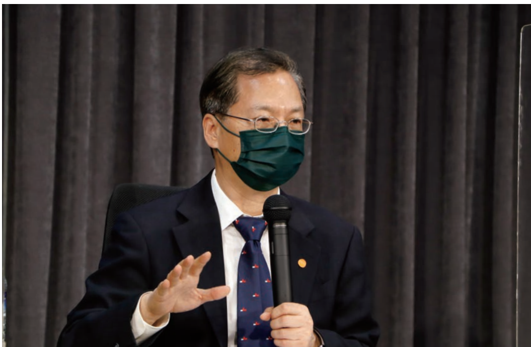
國發會龔主委明鑫於「行政院國發基金協助新創事業紓困融資加碼方案」線上記者會對外說明方案內容。

國發會龔主委表示，新創初期規模小，可能沒有營收，商業模式或跨域經營不易適用紓困產業類別及銀行授信評估。因此提出新創加碼貸款之構想，並多次與新創社