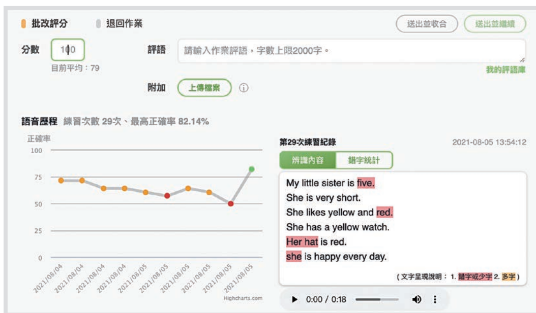
圖 5 如同貼身小助教，AI 語音辨識幫助學生調整自己的發音