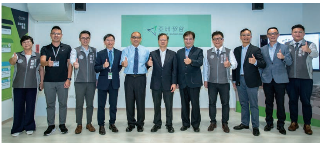
龔主委明鑫（左六）、鄭副主委貞茂（左五）、游副主委建華（右五）等人於亞洲·矽谷計畫執行中心展示廳合影。

亞洲·矽谷計畫自 2016 年推動迄今將近 4 年，已獲致豐碩成果，如 2018 年我國物聯網產值首度突破新臺幣兆元（詳見圖 1），在 2019 年再創新高，達新台幣 1.31 兆元，全球市占率也從 2018 年的 4.24% 成長到 2019 年的 4.33%，顯示物聯網已成為新的「兆元產業」。龔主委致詞時強調，「物聯網不僅僅是趨勢，而且是產業發展最重要的趨勢。」未來隨著亞洲·矽谷計畫的持續積極推動，應可順利達成 2025 年全球市占率達 5% 的既定目標。