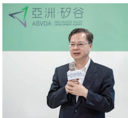
龔主委明鑫於亞洲·矽谷計畫執行中心致詞。

亞洲·矽谷計畫自 2016 年推動迄今將近 4 年，已獲致豐碩成果，如 2018 年我國物聯網產值首度突破新臺幣兆元（詳見圖 1），在 2019 年再創新高，達新台幣 1.31 兆元，全球市占率也從 2018 年的 4.24% 成長到 2019 年的 4.33%，顯示物聯網已成為新的「兆元產業」。龔主委致詞時強調，「物聯網不僅僅是趨勢，而且是產業發展最重要的趨勢。」未來隨著亞洲·矽谷計畫的持續積極推動，應可順利達成 2025 年全球市占率達 5% 的既定目標。