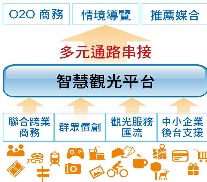
圖 4 智慧觀光平臺之跨業鏈結運作概念