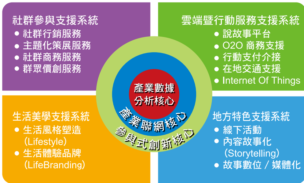
圖 1 推動花東智慧觀光的 Data-Driven 策略機制